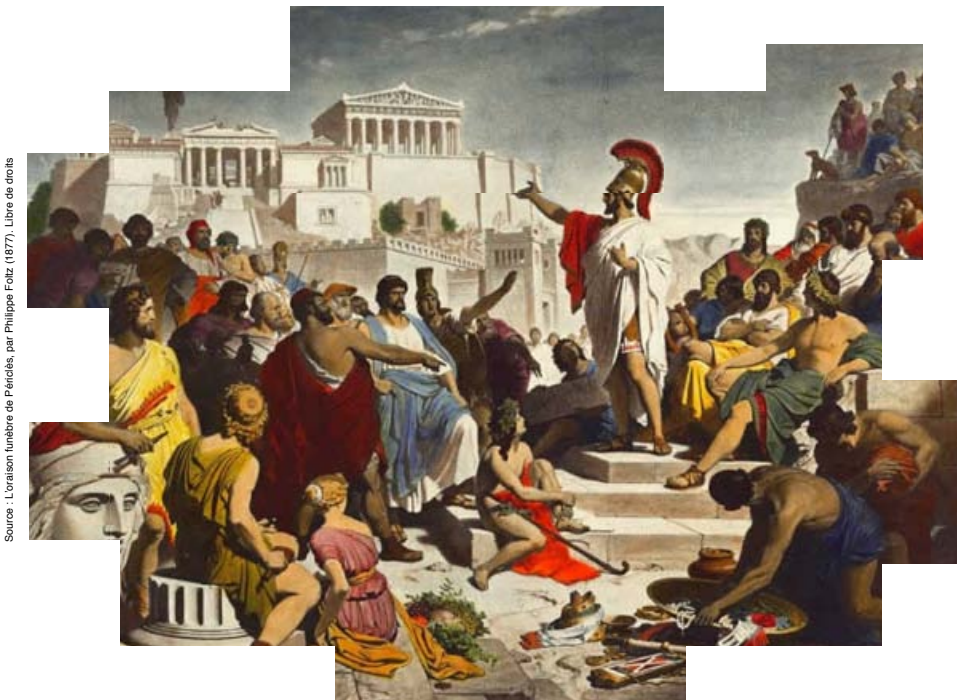
Source : L'oraison funèbre de Périclès, par Philippe Foltz (1877). Libre de droits